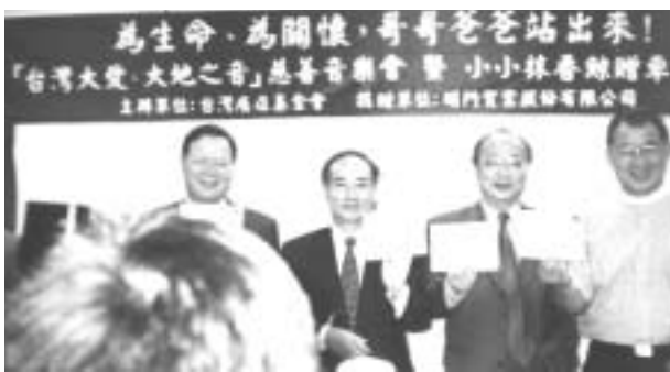
由左至右廖正豪、王金平、胡志強、王建煊等四位政要，共同出示貼有老婆照片的婦女健康護照。

幾位叱吒政壇，代表各政黨的政治人物，打破政治藩籬，共同出席記者會，暢談愛妻、愛家人、防癌的理念。包括國民黨發言人胡志強，以及親民黨、新黨、民進黨的代表廖正豪、王建煊、沈富雄等皆呼籲天下男人，愛她就別忘了叮嚀她定期癌症篩檢。最後四位政治鐵漢並萬分溫柔的出示，貼著心愛老婆照片的「婦女健康護照」宣誓永遠地疼愛老婆，並呼籲全國的哥哥爸爸站出來，鼓勵家中的女性定期做子宮頸抹片檢查。